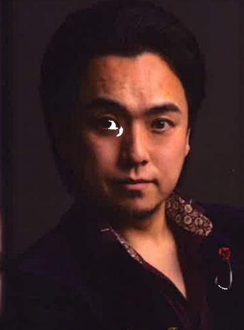
Takuya Fujita Tenore 藤田卓也